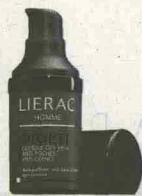
VIA BORSE E OCCHIAIE DIOPTI CONTOUR DES YEUX LIERAC HOMME (23 EURO)