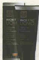
CON VITAMINE E GINSENG CREMA VISO ANTIETÀ RIVITALIZZANTE BIOTIYC UOMO (9,60 EURO)