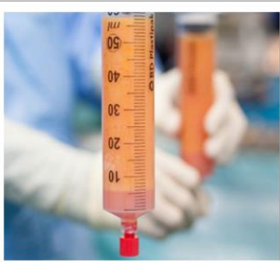
Fig. 1. Purificazione del tessuto adiposo

Durante la prima fase dell'intervento il tessuto adiposo viene prelevato mediante microcannule facendo attenzione ad utilizzare una bassa pressione di aspirazione per non danneggiare gli adipociti, successivamente viene purificato separando la componente adiposa pura dalle componenti accessorie oleose ed ematiche.