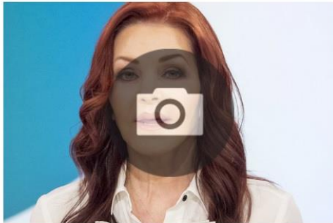
Star rifatte e pentite: da Loredana Bertè a Ilary Blasi

Vedo in giro tanti "mostri", soprattutto donne, e mi chiedo come facciano a piacersi. Secondo lei quando la chirurgia estetica diviene invasiva? Quando anziché migliorare l'aspetto lo stravolge? Le confesso che - visti certi risultati - sono profondamente indecisa se sottopormi o no a una blefaroplastica. Lei cosa consiglia alle sue pazienti, impone dei limiti alle loro richieste? Lulu 65, Milano